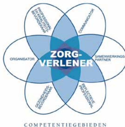
Figuur 1. CanMEDS-systematiek

Zoals in de inleiding van dit document naar voren kwam moet het Expertisegebied justitieel verpleegkundige beschouwd worden als een verdieping van en aanvulling op het Beroepsprofiel verpleegkundige (Lambregts & Grotendorst, 2012). Het Beroepsprofiel beschrijft de elementen van het beroep die voor elke verpleegkundige van toepassing zijn en ook voor de verpleegkundigen die onder een Expertisegebied vallen. Om de verbinding tussen het Beroepsprofiel en het Expertisegebied te verhelderen, komen de kennis en vaardigheden uit het Beroepsprofiel terug in het Expertisegebied. Vervolgens worden vanuit deze basis de aanvullende kennis en vaardigheden van de justitieel verpleegkundige beschreven. Dit alles wordt uitgewerkt aan de hand van de CanMEDS-systematiek (Canadian Medical Education Directions for Specialist). Deze systematiek bestaat uit zeven verschillende rollen. De kern van de beroepsuitoefening is de verpleegkundige als zorgverlener. Alle andere rollen raken en staan in het teken van deze centrale rol. De rol van zorgverlener geeft richting aan de andere CanMEDS-rollen.